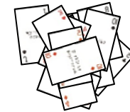
第1フェーズで使ったカード （場から外す）