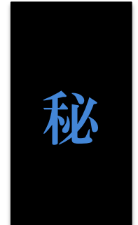
創造仕事の コンサル