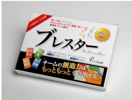
製品開発 (発想支援ツール)