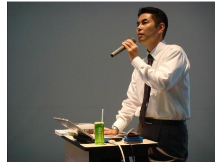
講演 ワークショップ