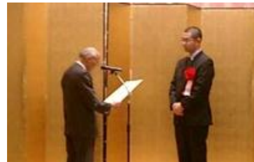
仙台ビジネスグランプリ